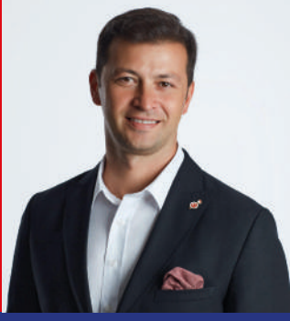
Erhan Ertürk Türkiye Kürek Federasyonu Başkanı